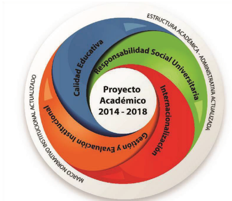
Figura 4. Dimensiones y programas del Proyecto Académico 2014-2018. Las cuatro dimensiones contemplan 78 líneas de acción estratégica