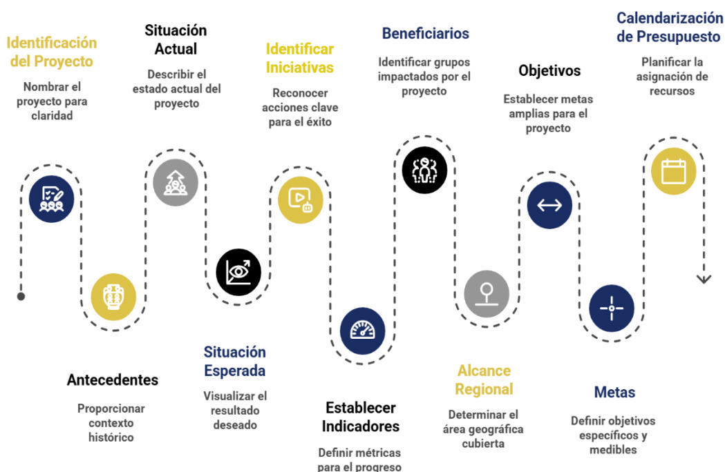
Figura 8. Etapas para la Formulación de POA de Subsidio Ordinario