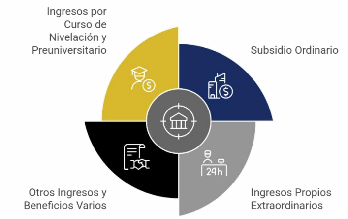
Figura 6. Fuentes de Financiamiento