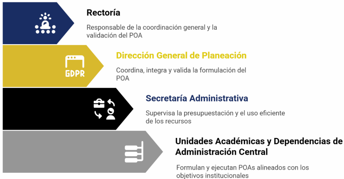
Figura 5. Actores que participan en la formulación del POA