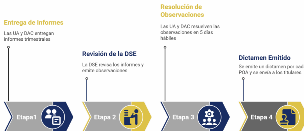
Figura 10. Procedimiento general del monitoreo y evaluación