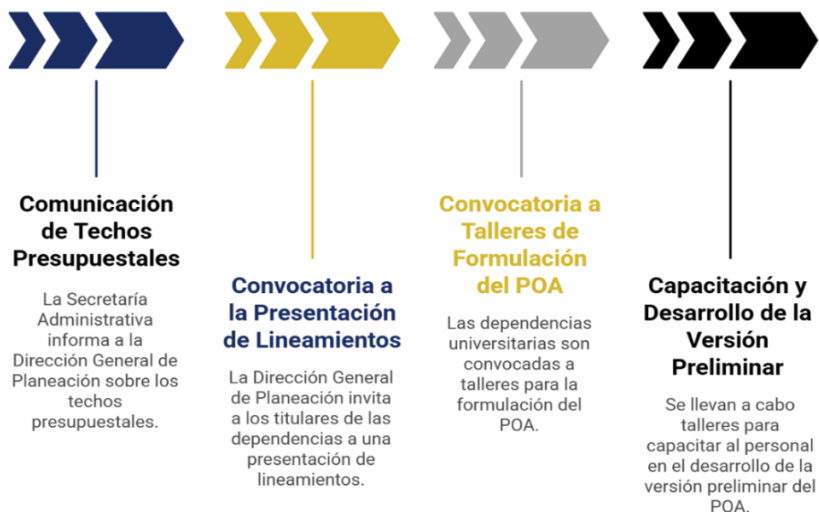
Figura 7. Etapas previas a la formulación del POA

Para formular el POA, con fuente de financiamiento de subsidio ordinario, se seguirán las siguientes directrices: