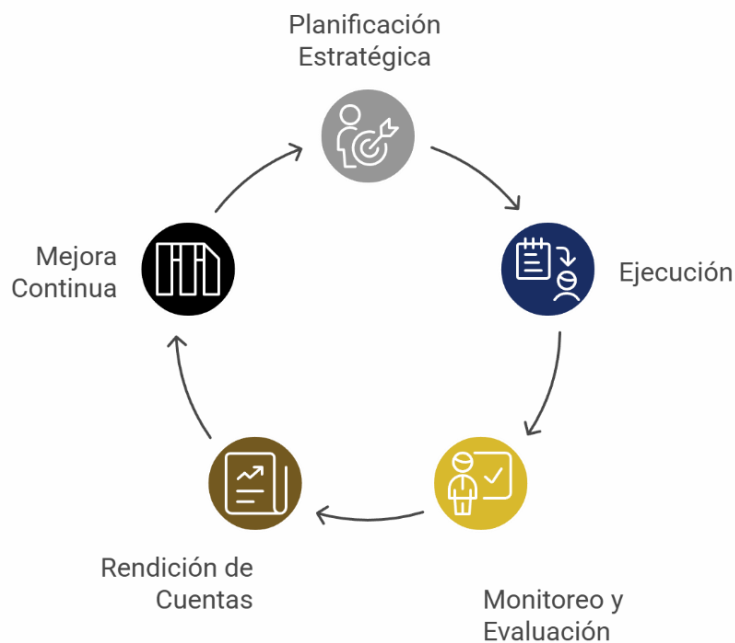
Figura 3. Ciclo de planificación basada en resultados