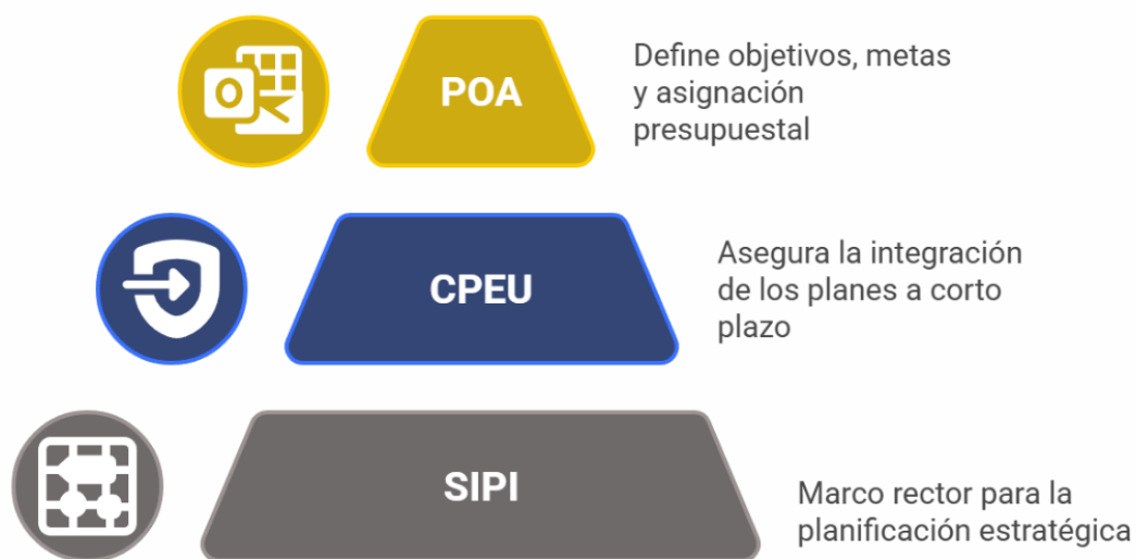
Figura 1. Estructura de Planeación Institucional