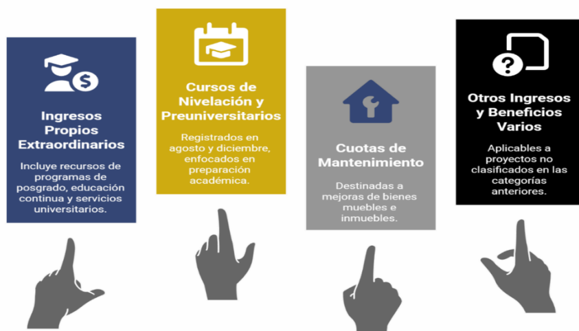
Figura 11. Tipos de POA de Ingresos Propios Extraordinarios