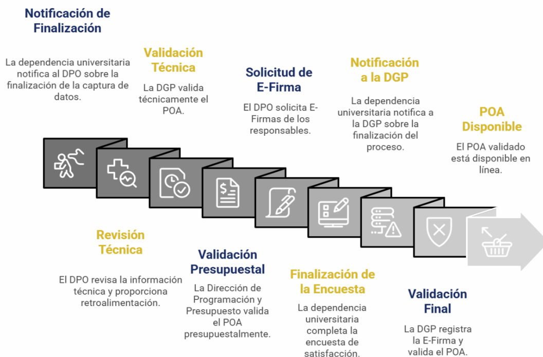
Figura 9. Etapas de validación del Programa Operativo Anual